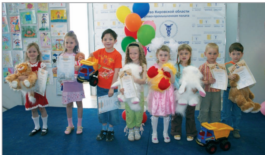
Победители конкурса рисунков «Кукла моей мечты»

Я искренне завидую работникам фабрики «Весна». Вы можете прикоснуться к детству, сделать мир вокруг себя добрее и светлее и хотя бы ненадолго подарить кому-то счастье.